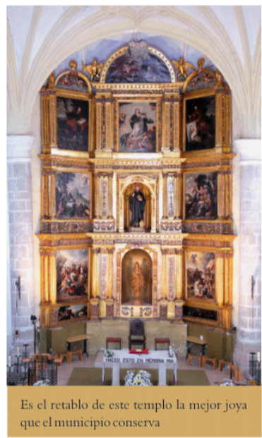
Es el retablo de este templo la mejor joya que el municipio conserva

Entre los monumentos destaca la iglesia de San Benito Abad, una magnífica obra arquitectónica del siglo XVI. Destaca en su aspecto exterior, como más llamativa, la portada orientada a mediodía, un bello ejemplar renacentista en su periodo de clásica severidad. A los pies del templo se alza la torre, acabada en 1660. En el interior consta de tres naves, separadas por cilíndricos pilares de los que arrancan las bóvedas de los tramos que componen la nave; estas bóvedas son de crucería de traza gótica en el crucero, y con relieves renacentistas en el resto. Pero sin lugar a dudas, si destaca la iglesia de San Benito Abad, es por su magnífico retablo mayor, obra de talla y pintura compuesta en 1656. Sus autores fueron el pintor Matías Jimeno y el ensamblador Pedro Castillejo. Sus composiciones pictóricas presentan escenas de la Historia Sagrada, entre las que destacan especialmente algunas mostrando milagros y