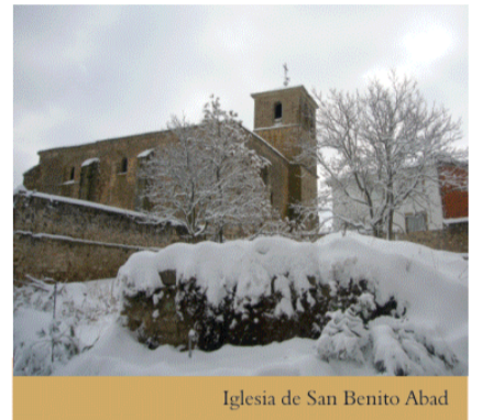
Iglesia de San Benito Abad

Destaca la plaza de la iglesia, con soportales, y su céntrica fuente, de estilo rústico y la ermita de la Soledad en los alrededores del núcleo urbano.